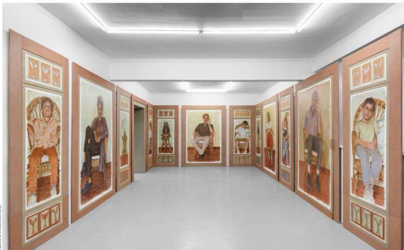
Charles Laib Bitton, vue de l'exposition "Figuratio", à la galerie Irène Laub à Bruxelles.

pour devenir un opérateur de continuité, presque un motif d'ancrage. Il rappelle que tous ces êtres ont partagé le même lieu, la même lumière oblique de Toscane, le même sol en terre cuite. Le monde de l'atelier persiste en chacun d'eux comme une basse continue. Cette cohérence n'est pas seulement spatiale. Elle est aussi atmosphérique. Les tonalités terreuses, les verts passés, les ocres rosés, les bruns mats, les blancs cassés composent une gamme volontairement restreinte, née d'une palette de quatre pigments seulement. Rien ne cherche l'éclat facile. Tout concourt à faire baisser le volume du monde pour laisser place à la vibration de la matière.