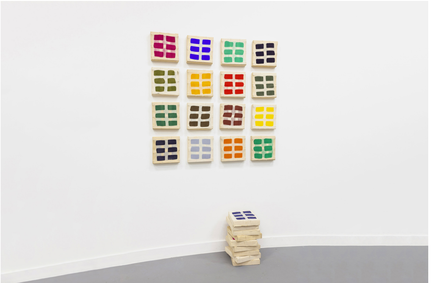
A non-u-mental history M HKA Part 1: fondation Gordon Matta-Clarck, MuHKA, Antwerp (BE), 2021

Né en 1939 à Bruxelles (BE) Vit et travaille à Bruxelles (BE)