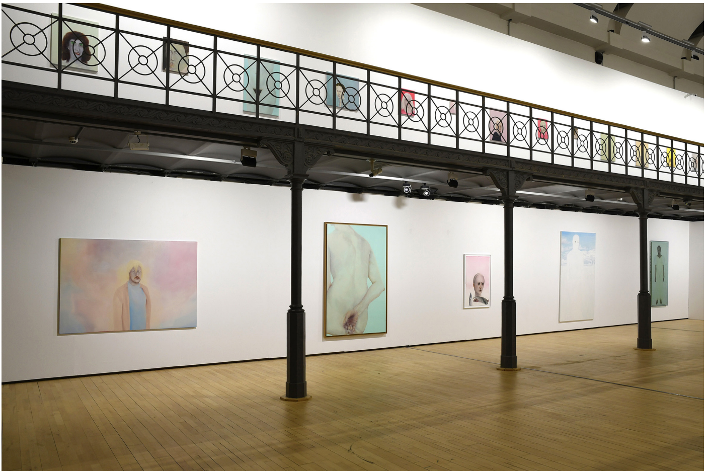
Gauthier Hubert, exhibition view of «...Fils de...» ( les retrouvailles ), Le Botanique, Brussels (BE), 2020

Né en 1967 à Bruxelles (BE) Vit et travaille à Bruxelles (BE)