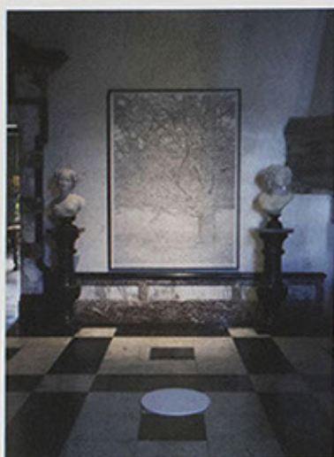
1:1, potlood op papier, 125x185cm, 2017, installatie in het kasteel van Chimay.

Ongeacht of hij nu werkt naar de natuur of haar in een schema onderbrengt, telkens weer spelen de wisselingen van licht en kleur, het verglijden van de tijd en de veranderingen van positie en schaal een rol in het werk van Stijn Cole. Cole heeft zich tot een kunstenaar ontpopt die, rondstruinend doorheen de kunstgeschiedenis en de echte en de digitale wereld, het landschap naar zijn eigen(tijdse) hand zet.