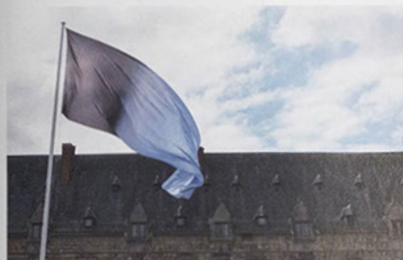
Sunrise 14/02/2017, vlag, 300 x 800 cm, voor het kasteel van Chimay, 2017. (© Stijn Cole)

"maar ik laat de computer de 256 meest aanwezige in zo'n foto ophalen." Dat digitale procedé heeft Cole al vaker toegepast, onder andere in 2015 toen hij op verzoek van curator Christa Vyvey met vijf andere Vlaamse kunstenaars 'op pelgrimstocht' gestuurd werd voor de tentoonstelling El Camino - de weg tussen twee punten . De roadtrip van Cole resulteerde in twaalf stopplaatsen die hij fotografeerde en omzette in 'colorscapes' van 256 gekleurde vlakjes. "Ik ben een documentaire kunstenaar, ik spreek alleen van wat je hier ziet, dit is een werkelijk landschap, geen romantisch", beklemtoont Cole. Als hij met zijn dochtertje van het ene 'eind van de wereld' in Finistère in Bretagne naar het andere op Cabo Fisterra in Galicië reist om een zonsopgang in drie richtingen vast te leggen en die vervolgens transformeert tot abstracte triptieken, buigt hij een romantische traditie om naar een objectieve feitelijkheid van afnemend licht.