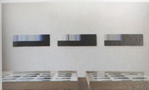
60 journées d'été, fotoprint op bariet, 2016. (© Stijn Cole)