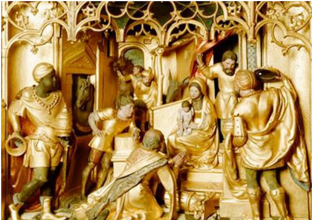
Retable d'Enghien (détail).

structures-prothèses sur roulettes en verre, convoquant différents éléments qui ne livrent pas tous leurs secrets.