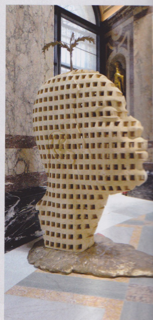
FIG. 6 (CI-DESSUS ET EN BAS) : Aimé Mpane (né en 1968). Nouveau souffle ou le Congo bourgeonnant , 2017. Vit et travaille à Nivelles, Belgique. Bois et bronze. MRAC, 2017.7.1.

1897 Exposition internationale de Bruxelles and, by extension, is an homage to all of the Congolese victims of colonization. In an adjoining gallery, Michèle Magma shows herself side by side with her mother and her grandmother (figs. 5a-c), three frontally depicted women who gaze upon the visitor in an installation of photographs and drawings titled Mémoire Hévéa ( Hévéa Memory ). In the "Africans" gallery, devoted to the African presence in Belgium, Aimé Ntakiyica's Une histoire de famille: arbre généalogique #1 ( A Family Story: Genealogical Tree #1 ) is on view (fig. 3), shedding light upon the history of the Burundian diaspora. The center of the museum's great rotunda, where the colonial propaganda is the most palpable, now features a monumental head by artist Aimé Mpane, giving the central message of the museum back to Africa