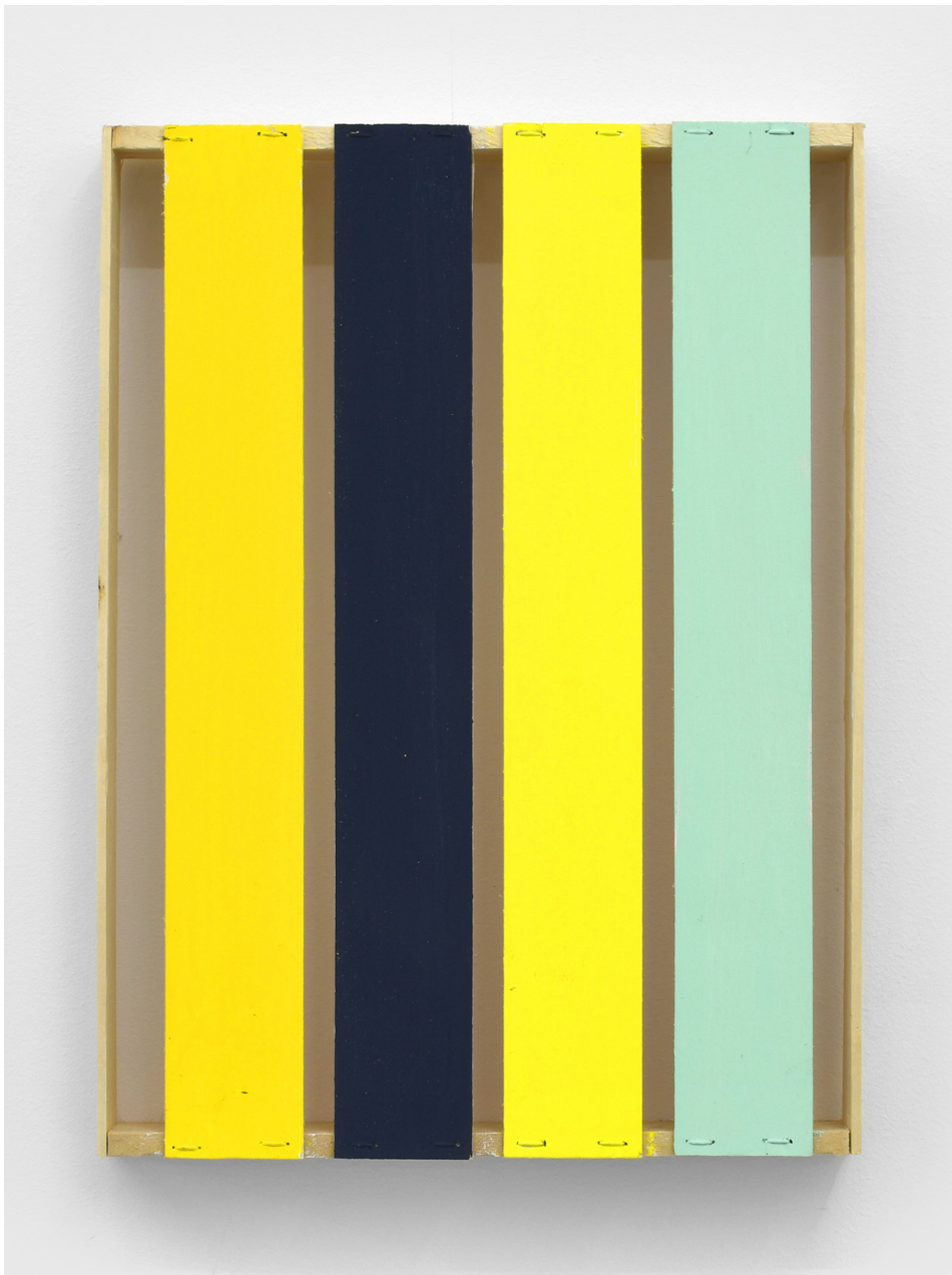
Bernard Villers, Cageot , 2019, Acrylic paint on wood, 39 x 29 x 4,5 cm