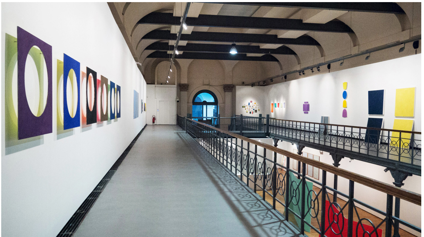
Bernard Villers, exhibition view of «La Couleur Manifeste» at Le Botanique, Brussels (BE)