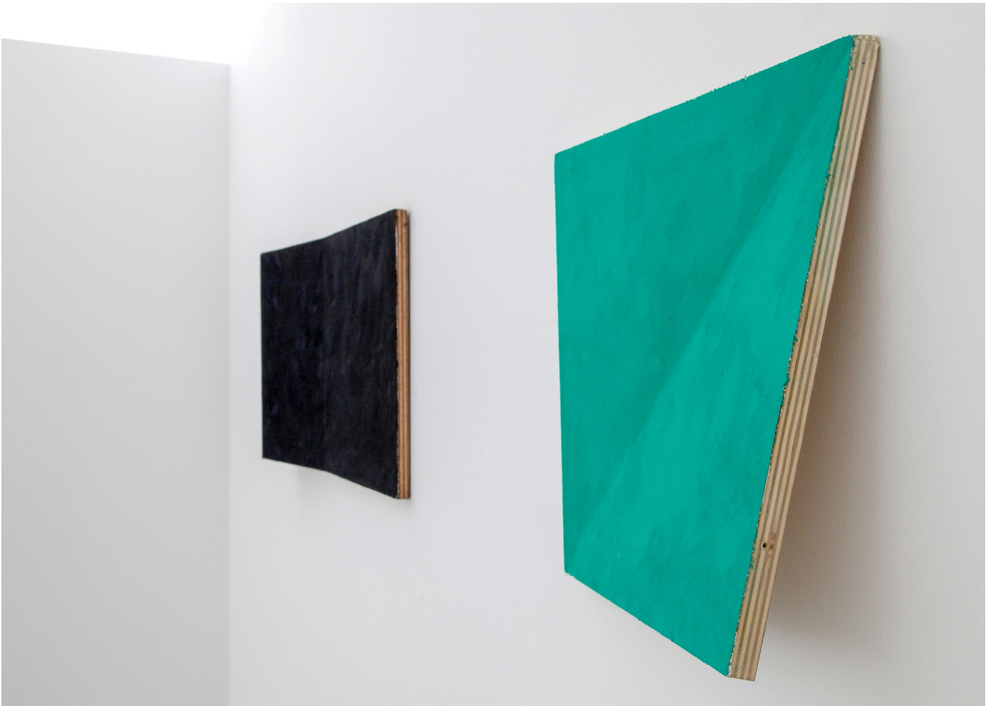
Bernard Villiers, Inclinaison , 2010, tempera, toile, bois, 40 x 35 x 5 cm (each)