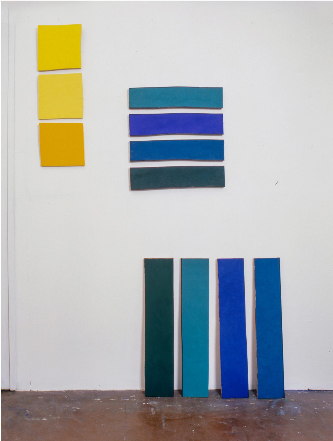
Bernard Villiers, 3 jaunes, 2 fois 4 cobalts , 1990, Tempera sur bois, variable dimensions