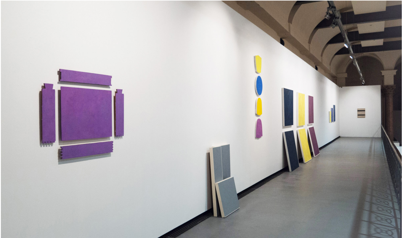
Bernard Villers, exhibition view of «La Couleur Manifeste» at Le Botanique, Brussels (BE)