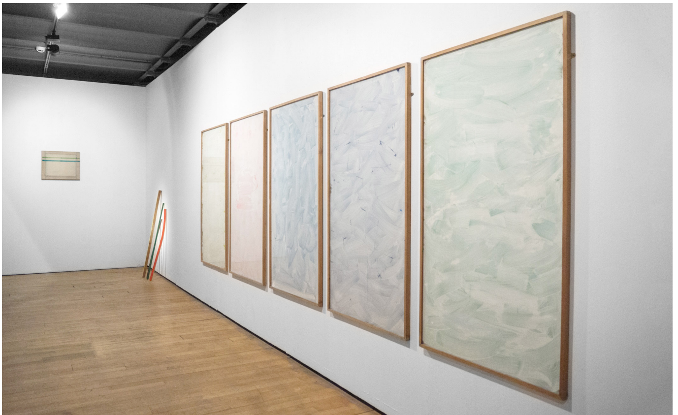
Bernard Villers, exhibition view of «La Couleur Manifeste» at Le Botanique, Brussels (BE), ©