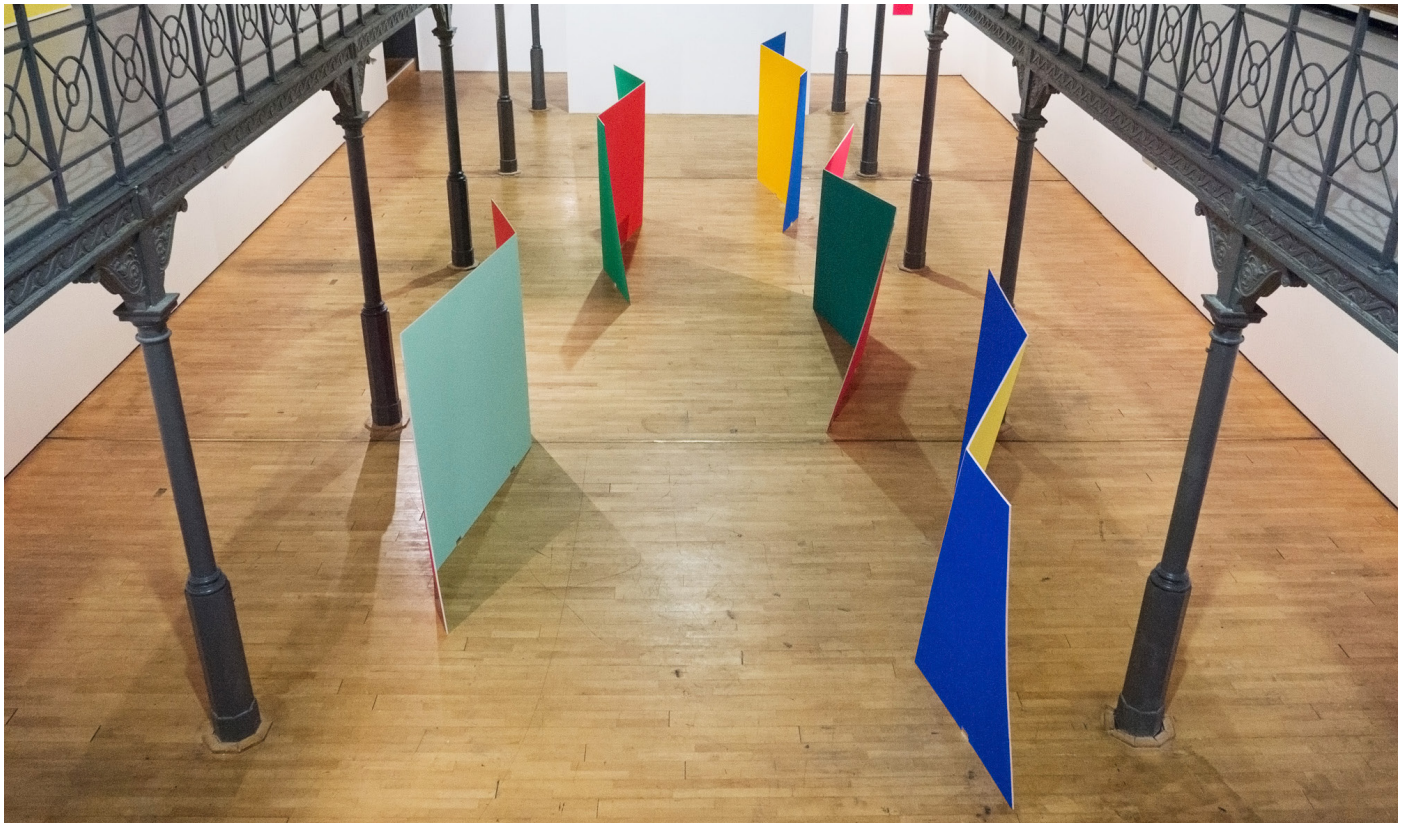
Bernard Villers, exhibition view of «La Couleur Manifeste» at Le Botanique, Brussels (BE), ©