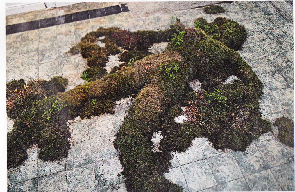
Sanne Avenhuis, 'Human Nature', 2009