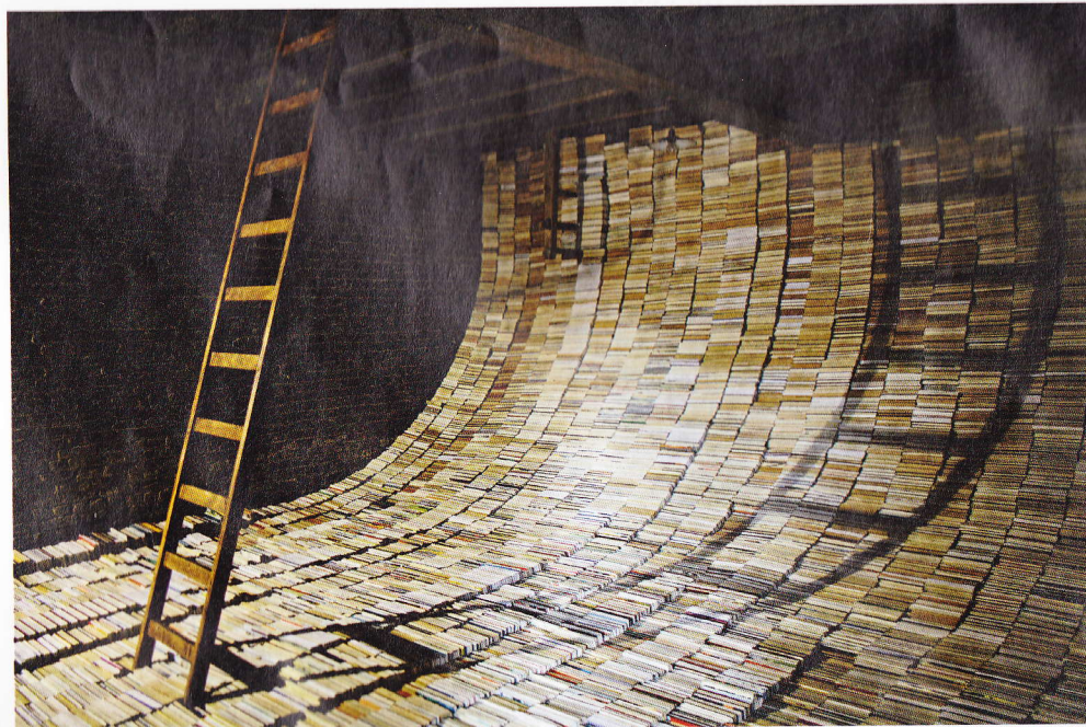
Thomas Ehgartner, 'Meaning Minus Truth Conditions #4', 2014