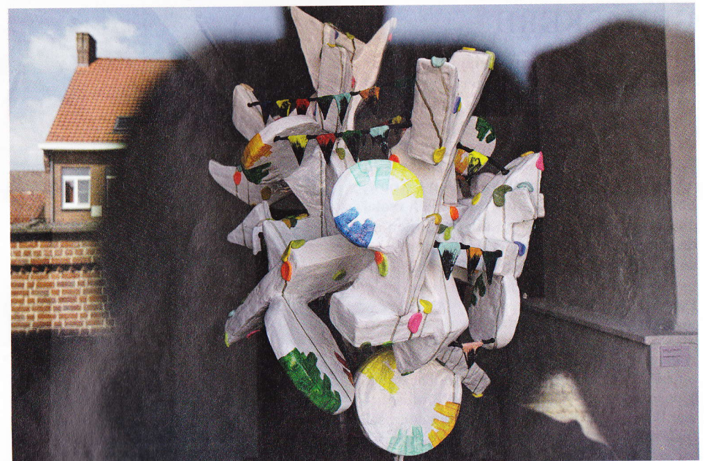
Tinka Pittoors, 'Omgevingsblindheid 2'.

evenementen. Voor de details: www.kunstemesculatwatou.be