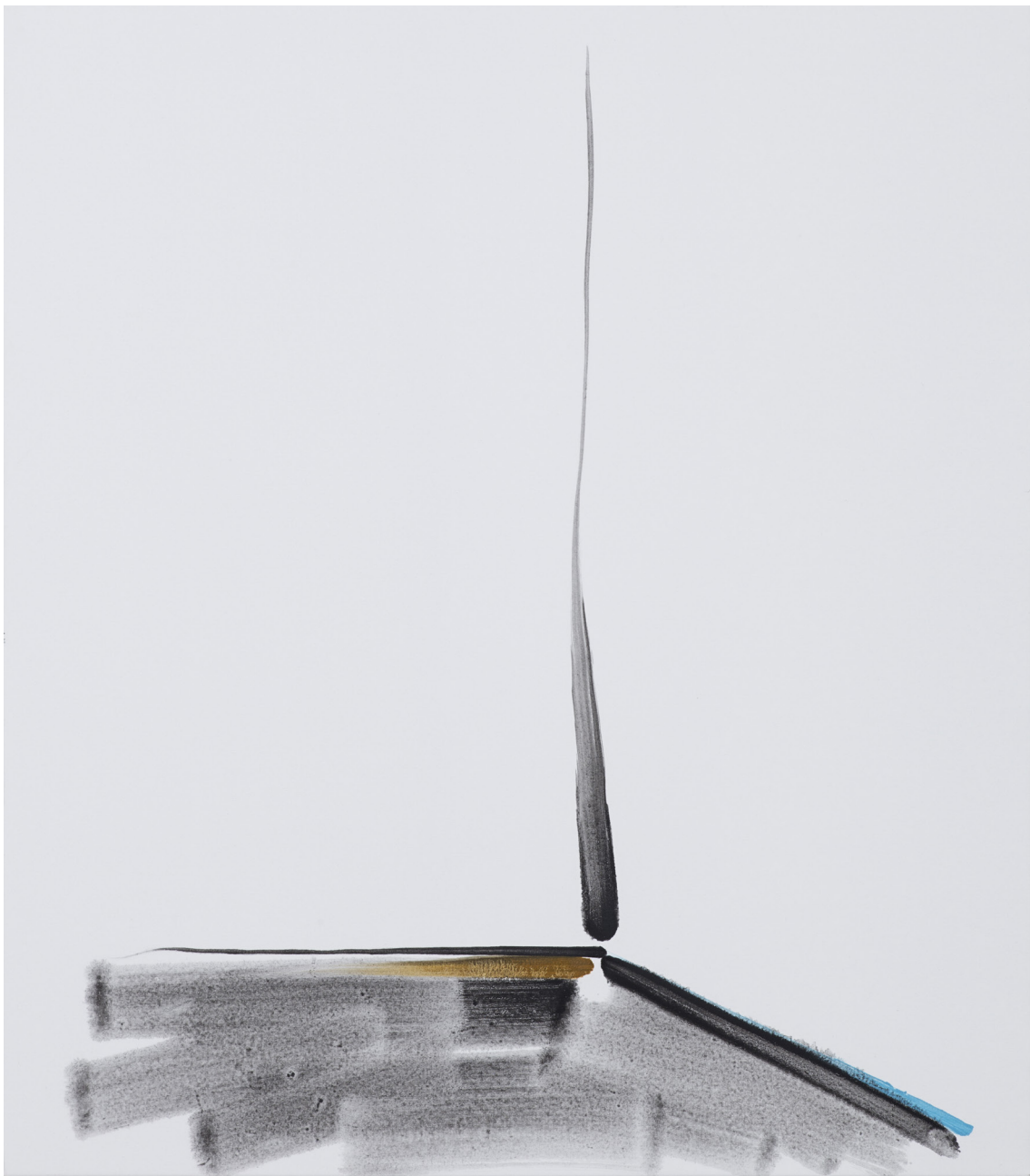
Panos Papadopoulos, Corner and floorboards , 2018, Oil on Canvas, 80x70cm

VERNISSAGE en présence de l'artiste 18.04.18, 18h > 21h