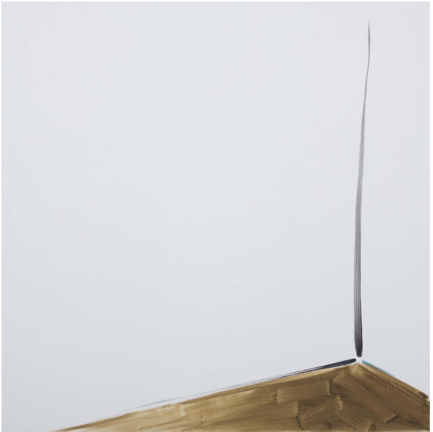
Panos Papadaopoulos, Corner and floorboards , 2018, Oil on canvas, 150x150cm

«Souvent, les gens me demandent si mes peintures à l'huile sont terminées ou pourquoi elles semblent si vides. Mes œuvres d'art précédentes étaient denses et intenses; elles étaient composées de plusieurs couches et étaient pleines de textes et d'informations. J'ai donc commencé à réduire à partir... de l'abstrait. J'aime profiter de la blancheur de la toile pour mettre en valeur les choses qui comptent le plus. Il est intéressant de voir comment les gens réagissent aux peintures minimales, surtout dans un monde où ils sont habitués à vouloir toujours plus. Mais il y a beaucoup de tension dans le dessin et la composition des couleurs, il suffit de prêter attention.» – Panos Papadopoulos, 2016