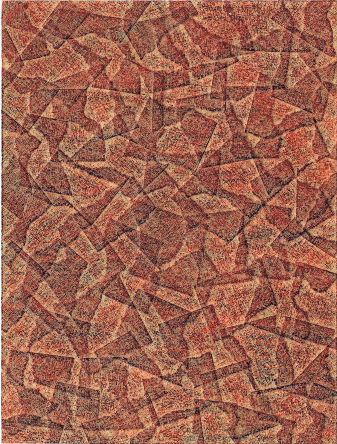
Untitled, 2016, Collage et crayons de couleur sur papier, 14 x 18 cm